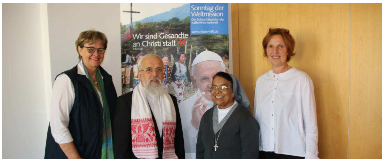
Schwester Enchenatil zu Besuch bei Bischof Dr. Gerhard Feige / Foto: Faber (Bistum Magdeburg)

aber auch Menschen, die am Tag der offenen Tür nicht die Gelegenheit hatten, das Libo in Augenschein zu nehmen.